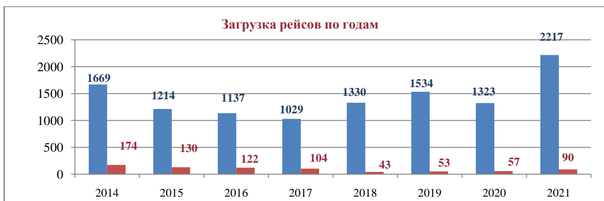
Рисунок 2 – Сравнительная диаграмма количества перевезенных пассажиров с 2014 года по 2021 года

В целях обеспечения регулярных пассажирских перевозок воздушным транспортом и обеспечения равной доступности транспортных услуг для жителей труднодоступных местностей Правительством Республики Тыва начиная с 2007 года ежегодно принимается постановление «Об утверждении льготных тарифов на перевозку пассажиров воздушным транспортом на местных воздушных линиях Республики Тыва», которым определяется предельная величина стоимости летного часа, размер льготных тарифов на текущий год и перечень категорий граждан, имеющих право на получение льгот при пользовании воздушным транспортом на территории республики.